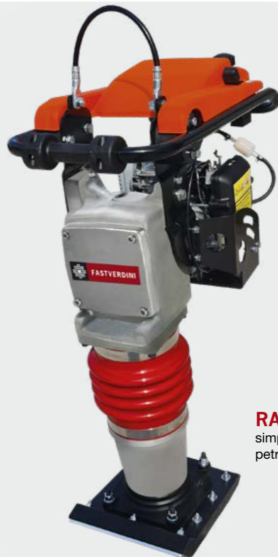
RAN 6TS simplified petrol