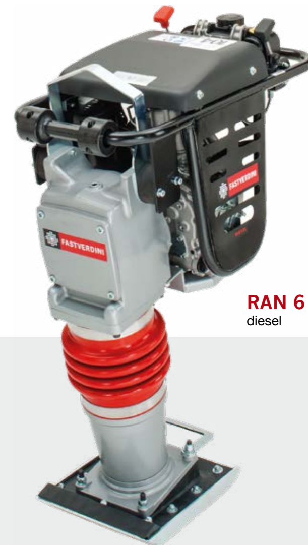
RAN 6 diesel