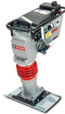
2 Piede allargato fino a 530 mm Enlarged foot up to 530 mm