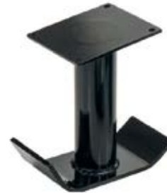
6 Dimensione piedino 150x320 mm H = 315 mm Foot dimensions 150x320 mm H = 315 mm