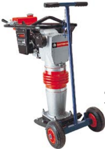
1 Carrello a due ruote Trolley for transport