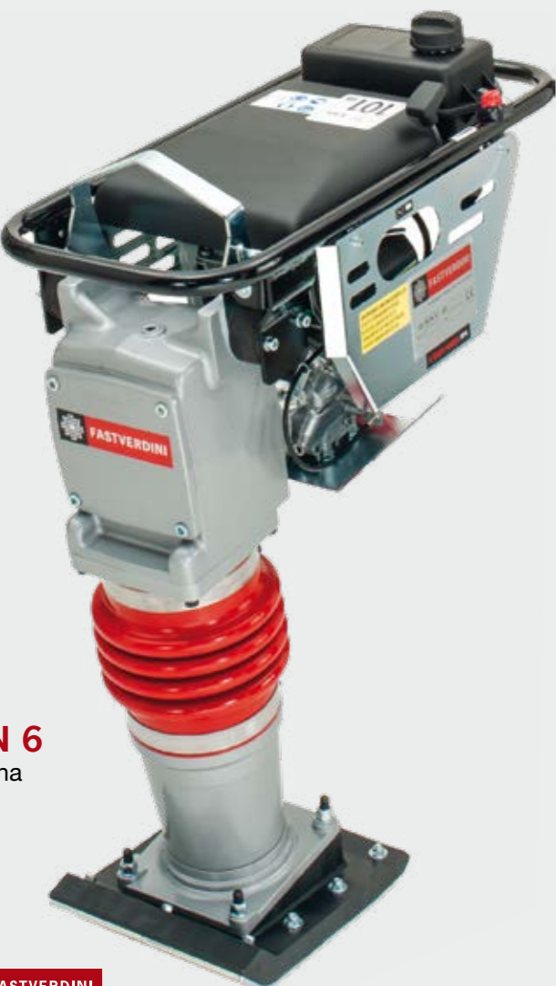
RAN 6 benzina petrol

Same construction characteristics as the RAN 6 model, with the difference that the handlebar is simpler with fewer lateral protection.