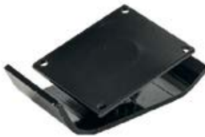
5 Dimensione piedino 150x320 mm H = 80 mm Foot dimensions 150x320 mm H = 80 mm