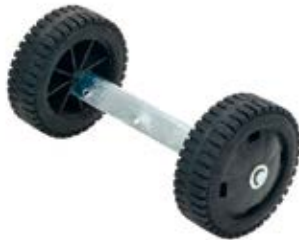
3 Ruote per trasporto su strade sconnesse Wheels for transport on rough roads